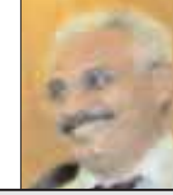
Türk Haber-Sen Genel Başkanı