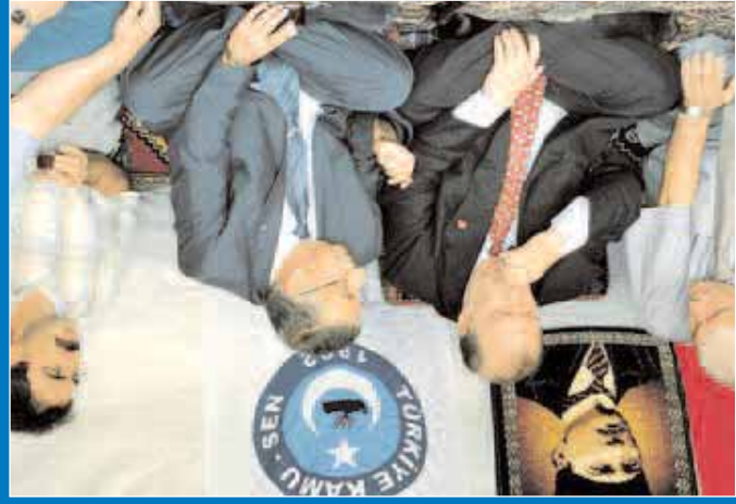
Hür Parti Genel Başkanı Yaşar Okuyan'ın ziyareti

Türkiye Kamu-Sen Genel Merkezi'nin geleneksel hale gelen Toplu Görüşme Takip Cadırı yine Sihhiye Abdi İpekçi Parkı'nda kuruldu. 15 Ağustos'ta Toplu Görüşmelerin başlaması ile birlikte faaliyete geçen Cadırın ilk olarak Başbakanlık'taki görüşmeye katılacak olan heyet üyeleri tarafından kuruldu. Toplu görüşmeler sırasında bazı eylemlere de sahne olan cadırın benzeri Türkiye Kamu-Sen'in il temsilcilikleri tarafından da faaliyete geçirildi. Kamu çalışanlarının buluşma noktası olan toplu görüşme