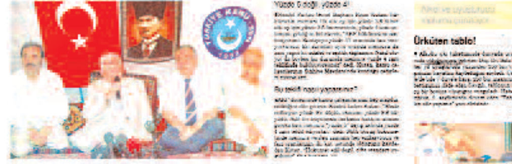
Yüksek Dövizli Yüzdeleri... Bu özellik neleri kapsar?...