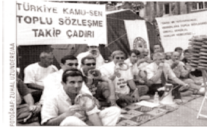
Memur sendikaları bugün saat 15.00'te ikinci tur toplu görüşmeler için masaya oturacak.