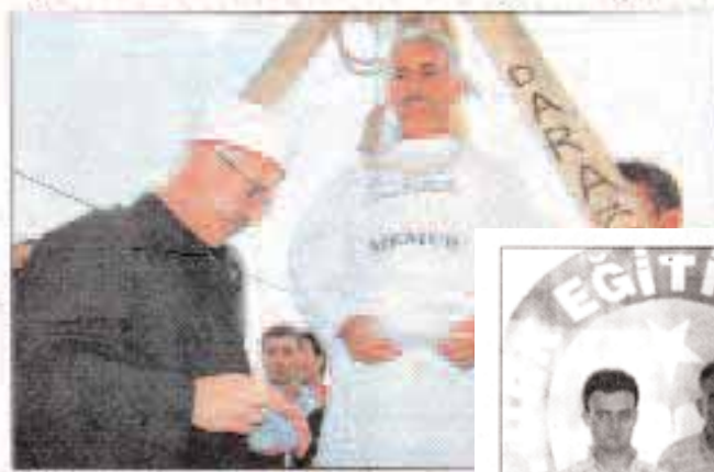
Öznel memur için sembolik sehpa eyleminde son duruş.

HÜKÜMETİN verdiği zam oranını beğenmeyen kamu çalışanları büyük şehirde eylemlere başladı. Akşam'da Kamu-Sen üyeleri kurdukları sembolik sehpa eylemlerine başladı. Ankara'da ise Memur-Sen üyeleri Başbakan Erdoğan'a boy atıldığını günderecekti. BAŞBAKAN Yardımcısı Mehmet Ali Şahin, en düşük maaş için önerdikten yüzde 15,7 zammın emilasyon oranının iki katı olduğunu söyledi. "Eğilim var, durdururum demek saçma, tehditler Devlet tehditlere boyun eğmez" dedi. ● B'DE