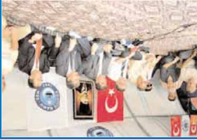
MHP heyetinin cadırımızı ziyareti...