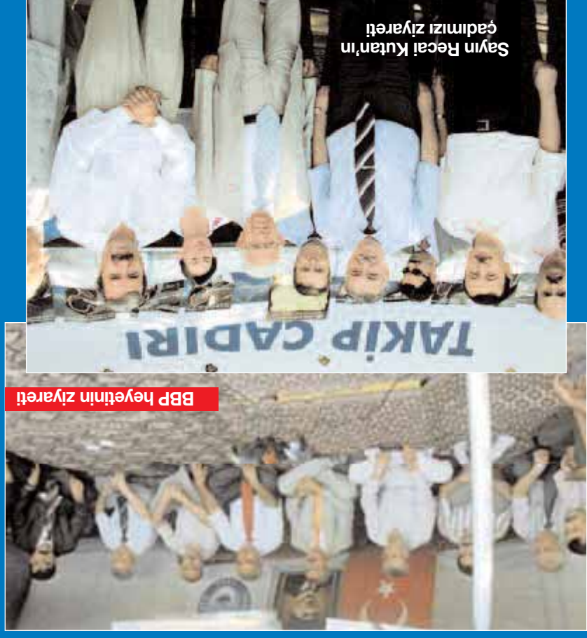
BBP heyetinin ziyareti